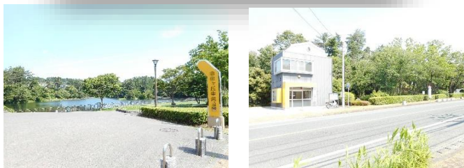
物件前には公園✦&派出所があります！！