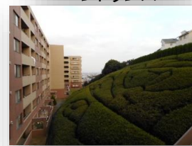
* 洋室側バルコニーからの眺め *