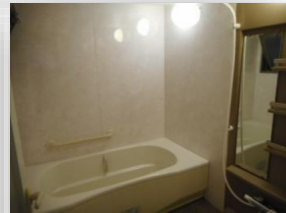
* 広々としたユニットバス *