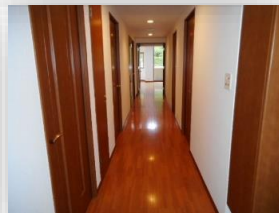
* 玄関からの長い廊下 *