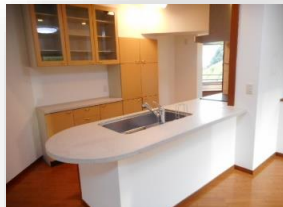
* IH対応のシステムキッチン *