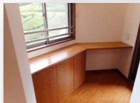
* キッチン奥の作業スペース *