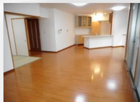
* 約26.8帖のLDK *