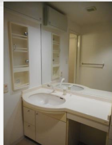
* シャンプードレッサー付洗面台 *