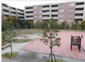
* 中庭の公園スペース *