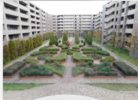
* 中庭 *