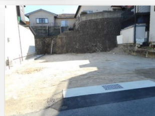
* 真正面からの土地全体 *