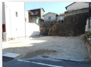
* 約50.05坪の土地です *