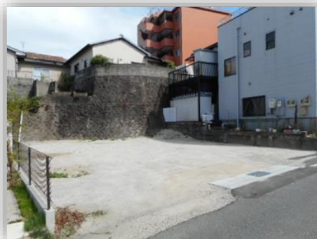
* 約50.05坪の土地です *