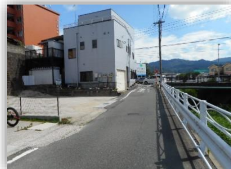
* 接道約10.69m *