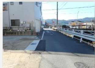
* 前面道路幅員約4.52m *