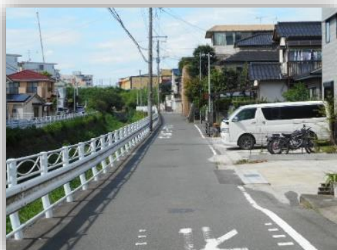
* 前面道路幅員約4.52m *