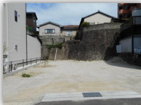
* 真正面からの土地全体 *