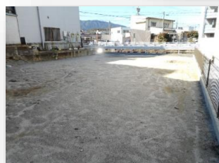
* 奥側からの土地全体 *