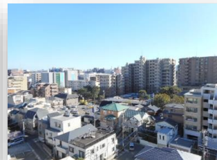
* バルコニーからの眺め *