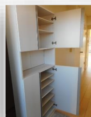
* たっぶり収納できるシューズボックス *