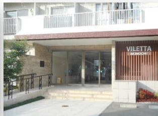
* エントランス *