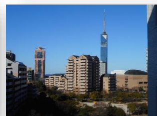
* 玄関前からの眺め *