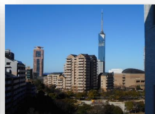
* 玄関前からの眺め *