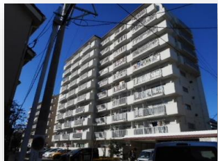
* 外観 *