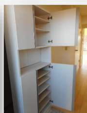
* たっぶり収納できるシューズボックス *