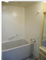
* 清潔感のあるユニットバス *