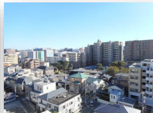
* バルコニーからの眺め *