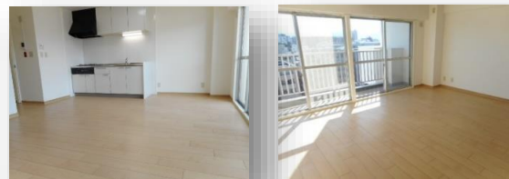
* 約12.5帖の明るいLDK *