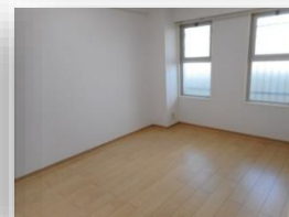
* 約6帖の洋室 *