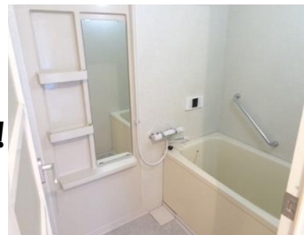
サーモ付きシャワー水栓・浴槽新品🎁 追い炊き機能あり！！