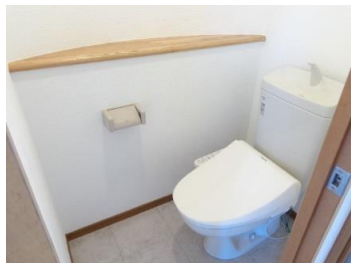
トイレ新品 ウォシュレット付き☆