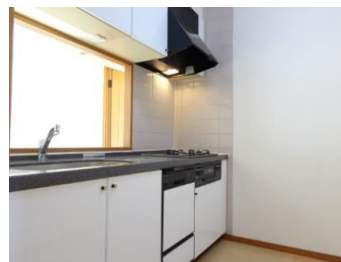
家事が楽になる食洗機付きシステムキッチン！ ビルトインコンロ・レンジフード新品🎁