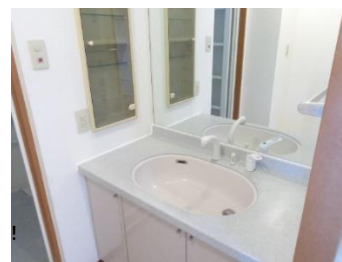
シャワー水栓交換！！ワイドミラーです🎁