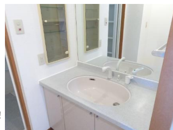
シャワー水栓交換！！ワイドミラーです♪