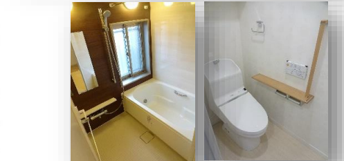
* 浴室乾燥機付きです * 温水洗浄便座 *