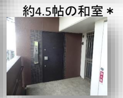
* 玄関から直接インナーバルコニーまでつながっています *