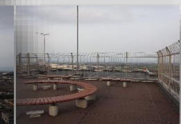
* 屋上スカイデッキからの眺望 *