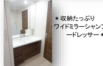
* 収納たっぷり ワイドミラーシャンプ ードレッサー *