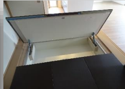
* 電動床下収納のある約4.5帖の和室 *