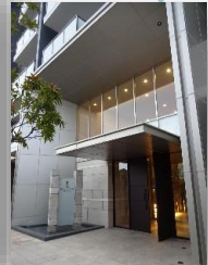
* エントランス前 *