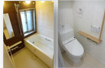
* 浴室乾燥機付きです ** 温水洗浄便座 *