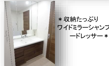
* 収納たっぷり ワイドミラーシャンプ ードレッサー *