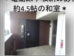
* 玄関から直接インナーバルコニーまでつながっています *