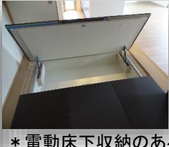
* 電動床下収納のある約4.5帖の和室 *