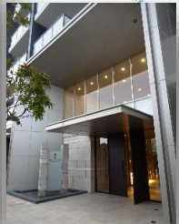
* エントランス前 *