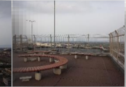
* 屋上スカイデッキからの眺望 *