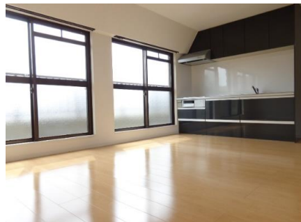
フローリング・クロス貼替 室内照明器具設置！！