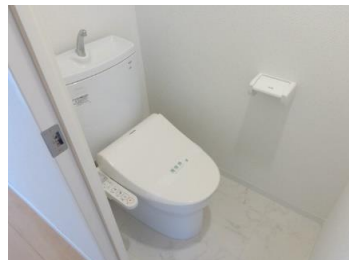
ウォシュレット・ペーパーホルダー新品