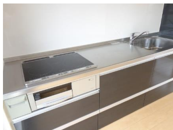
3口IHコンロ♪収納たっぷりシステムキッチン