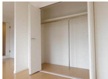
リビングに収納あり！！