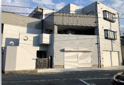
テナント正面入口