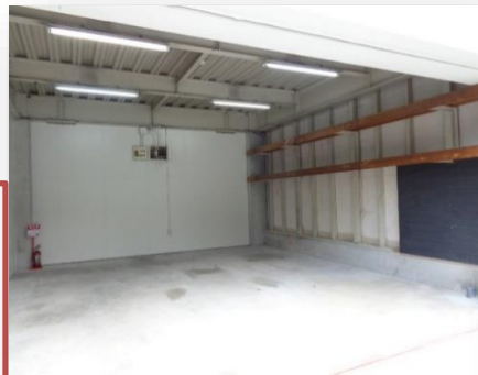
入口はシャッターになっています

平成29年10月内装・外装工事済み！！ 1階Aテナント、ご使用用途その他何でもご相談下さい！！