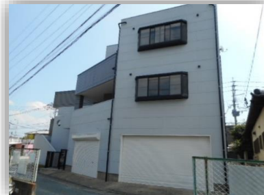
テナント正面入口