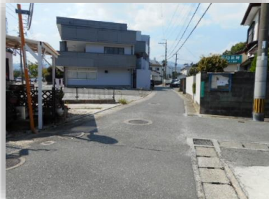
テナント前の道路