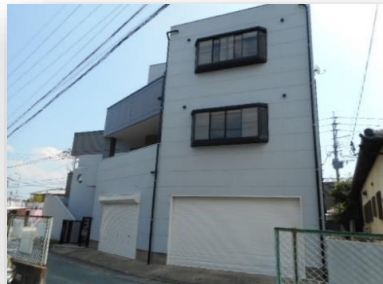
テナント正面入口