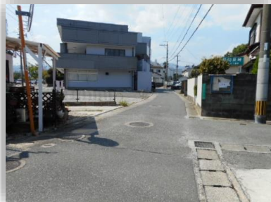
テナント前の道路