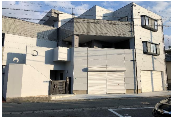
テナント正面入口