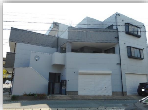
テナント正面入口