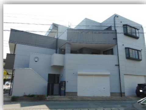
テナント正面入口