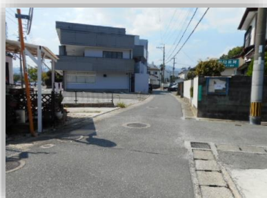
テナント前の道路