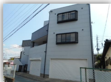
テナント正面入口

平成29年10月内装・外装工事済み！！ 1階テナント、ご使用用途その他何でもご相談下さい！！